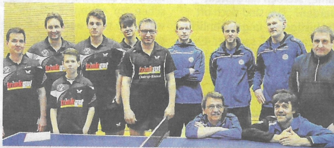
Die DJK Roland Rauxel II (schwarze Trikots) musste sich dem Post SV (blaue Jacken) mit 3:9 geschlagen geben.

In den folgenden Einzeln gewann Tauber mit 11:5 im vierten Satz gegen Duratovic. Ebenfalls im vierten Satz (11:8) bezwang Wagner den Rauxeler Chroscinski. Youngster Busemann war mit