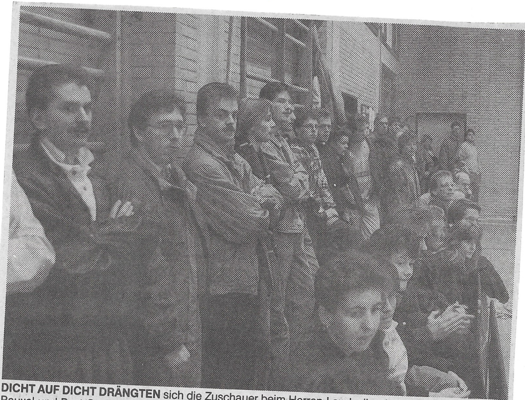
DICHT AUF DICHT DRÄNGTEN sich die Zuschauer beim Herren-Landesligaderby zwischen Roland Rauxel und Post Castrop — im Tischtennis hierzulande ebenso ungewöhnlich wie bemerkenswert.