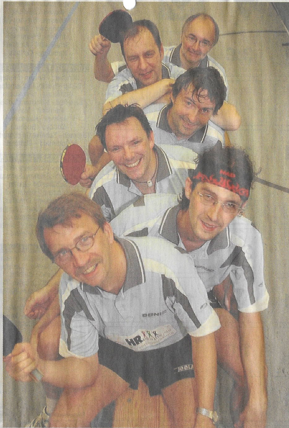
So lachen Tabellenführer. Das Tischtennis-Team des Post SV Castrop hält zurzeit in der Bezirksklasse den Platz an der Sonne.

Die „Dritte“ des Post SV allerdings fristet als Vorletzter ein karges Dasein im Tabellenkeller, mit sechs Punkten Rückstand auf den drittletzten Rang. Die Roländer Viertvertretung dagegen steht etwas komfortabler da, haben als Tabellenachter immerhin 10:14 Zähler.