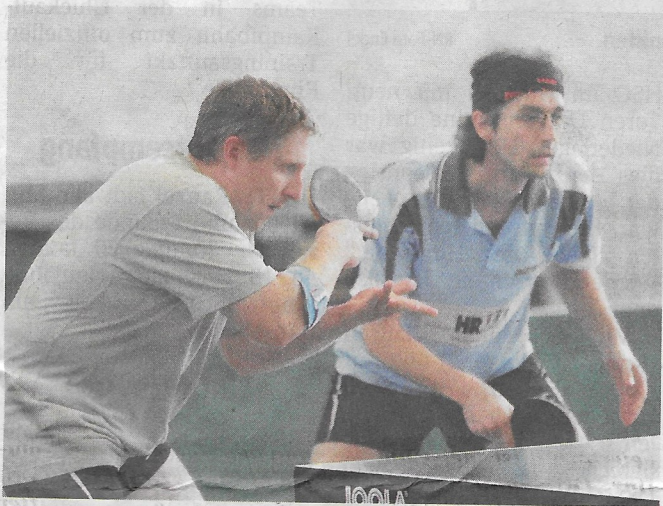
Das Doppel Tauber/Wagner soll für den Post SV Castrop in der Bezirksliga auch in Wattenscheid punkten.

Aufstellung: Wald, Erhardt, M. Bergins, F. Rieke.