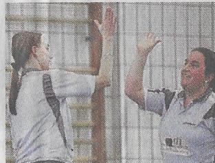
Vorfreude auf das Topspiel.

Auf ein echtes Spitzenspiel dürfen sich die Tischtennisfans in der Europastadt freuen. In der Damen-Verbandsliga gastiert der Tabellenführer TTC Wuppertal bei den nur zwei Punkten schlechteren Damen des Post SV. Dennoch ist die Ausgangslage eindeutig: Die Wuppertalerinnen reisen als Favoritinnen an, denn die