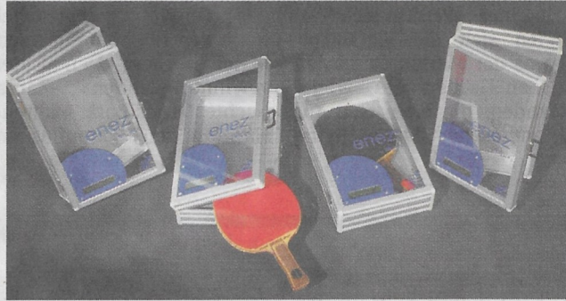
„Enez“ – der „Schnüffler“ in Kofferform.

Das Ritual Frischkleben im Tischtennis-Sport blickt auf eine langjährige Tradition. „Anfang der 80-er Jahre wurde die Technik von russischen Spielern entwickelt“, erklärt Christian Chroscinski von Roland Rauxel. „Damit konnten die Top-Spieler aus Europa den starken Asiaten erstmalig Paroli bieten.“ Und dann klebte fast die ganze Spitzenspieler-Szene.