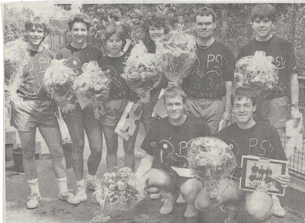
Großer Jubel und großer Bahnhof bei den Tischtennis-Spielern des Post SV. Sowohl die Herren als auch die Damen sicherten sich als Aufsteiger den Meistertitel. In der Oberliga sind die Damen derzeit „top“, in der Verbandsliga die Herren allerdings „flop“.