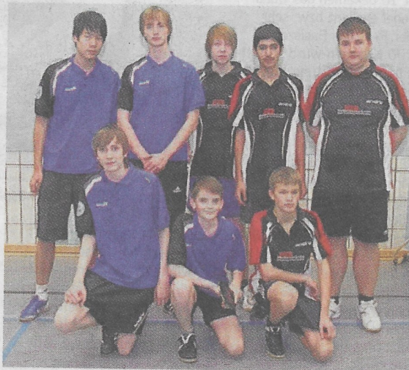
Im Jugendderby der Roländer gegen den Post SV-Nachwuchs siegten die Postler mit 8:4.