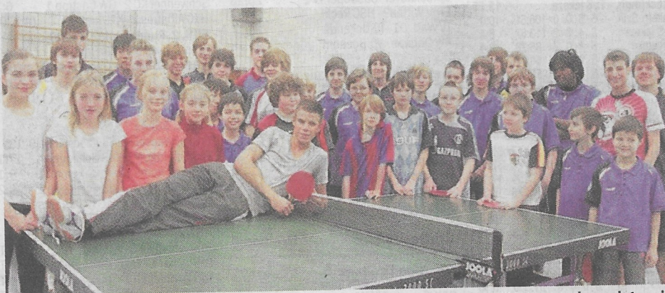
An und sogar auf der Platte stark: Der Tischtennis-Nachwuchs des Post SV Castrop beendete mit seinem „Weihnachtsturnier“ ein erfolgreiches Jahr.

Starke Talente beim Weihnachtsturnier. Raphael Reiß als „Spieler des Jahres“ geehrt