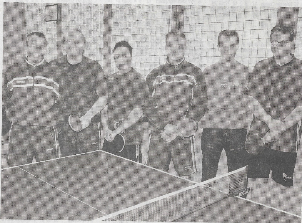
Der Post SV 4 setzte sich in der Kreisklasse mit 9:3 gegen den TTC Huckarde 3 durch.

16. Spieltag nicht überflügeln. Die Wittenerinnen verloren klar mit 1:8 beim Liga-Primus TKK Anröchte 2. Derweil schloss der SSV Hagen (8.) durch einen überraschenden 8:5-Sieg beim SV Morsbach (3.) bis auf einen Punkt zum Post SV auf. ■ -as