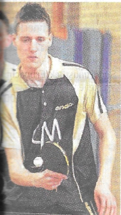
ph Pauly (re.) ist nicht en.

In Castrop-Rauxel sind zwei Tischtennis-Mannschaften in der Landesliga 4 des WTTV vertreten. Die DJK Roland Rauxel belegt derzeit nach 16 Spieltagen den sechsten Rang der Tabelle. Der Post SV Castrop liegt zwei Plätze dahinter auf Platz acht. Der- zeit steigt der Erstplatzierte der Abschlusstabelle auf, der Zweitplatzierte bestreitet ein Relegationsspiel um den Auf- stieg. Die letzten beiden in der Tabelle steigen ab, der zehnte Platz führt in die A stiegs-Relegation.