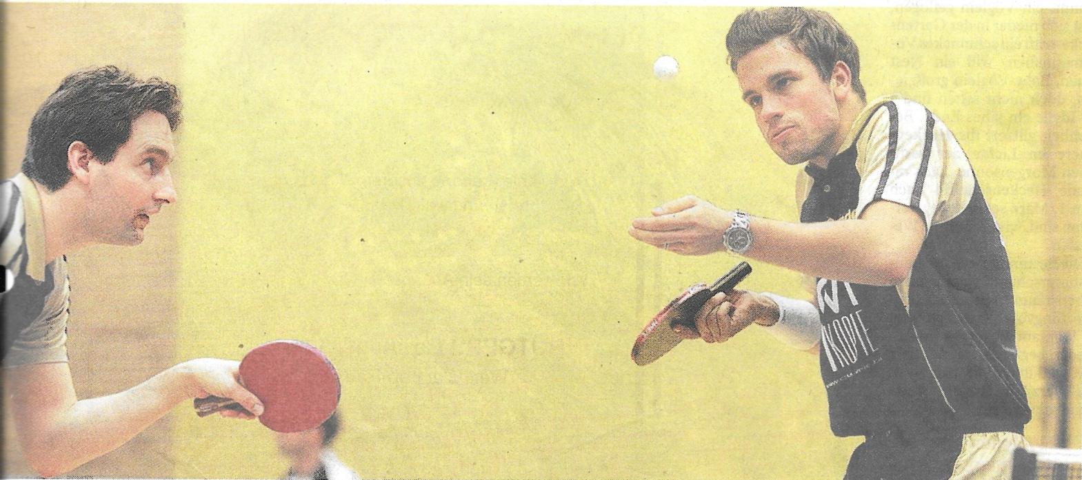
Augen der Tischtennispieler richten sich derzeit nicht nur auf den Ball, sondern auch auf die geplante Strukturreform im DTTB.