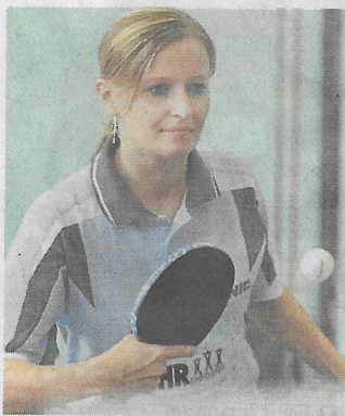
Margarethe Bursy.

Die Vorzeichen stehen gut. Die PSV-Frauen treten beim Tabellensiebten in Bestbesetzung an. Zudem ist die Rückrunden-Bilanz der Gegnerinnen wenig Furcht einflößend: Ein Unentschieden und drei