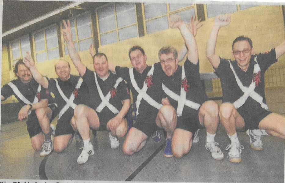
Die Rückkehr in die 1. Kreisklasse feierten die 3. Herren des Post SV Castrop nach dem 9:5-Arbeitssieg gegen den TTV Asseln.