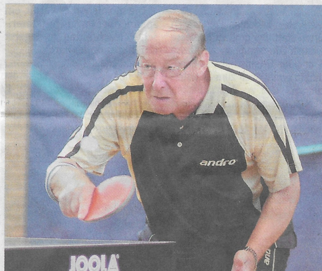
Heribert Send und Co verpassten in der 2. Kreisklasse mit Roland Rauxel 5 den Anschluss an die Tabellenspitze.

In der 3. Kreisklasse kostete die „unglückliche“ Doppelaufstellung Roland Rauxel 6 (7.) einen Teilerfolg. Lars Schwittek war mit seiner Beteiligung an drei Zählern erfolgreichster Punktesammler. Für Post SV 5 war beim 6:9 in TuS Rahm 5 fast eine Überraschung drin. Doch die Postler verloren am Ende etwas unglücklich. Eifrigste Punktesammler waren Kohtz und Bock im Einzel und im Doppel. ■ Sto