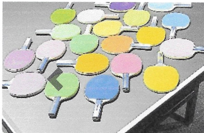
Ab 2021 gibt es mehr Möglichkeiten für die Gestaltung von Tischtennisschlägern...