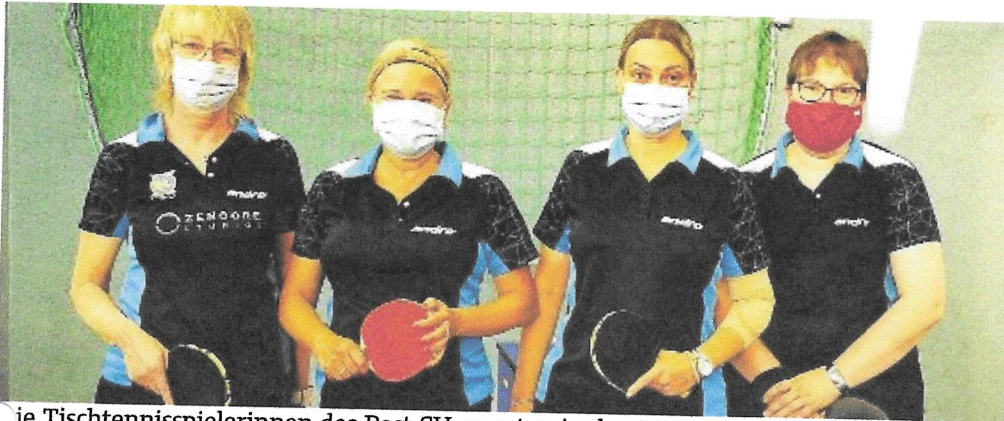
Die Tischtennisspielerinnen des Post SV mussten in den Momenten, in denen sie nicht spielten, in Herten Masken tragen.

TISCHTENNIS: In der Frauen-Verbandsliga stehen Postlerinnen mit Oberhausen gleichauf.