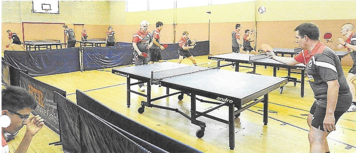
Nicht mehr auf Gegner aus Dortmund, Bochum und Herne treffen bald die Tischtennispieler.