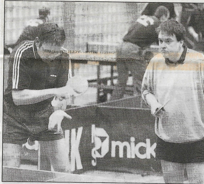
Mannschaft drei der Roländer erkämpften einen Punkt gegen den Tabellenführer aus Dortmund.