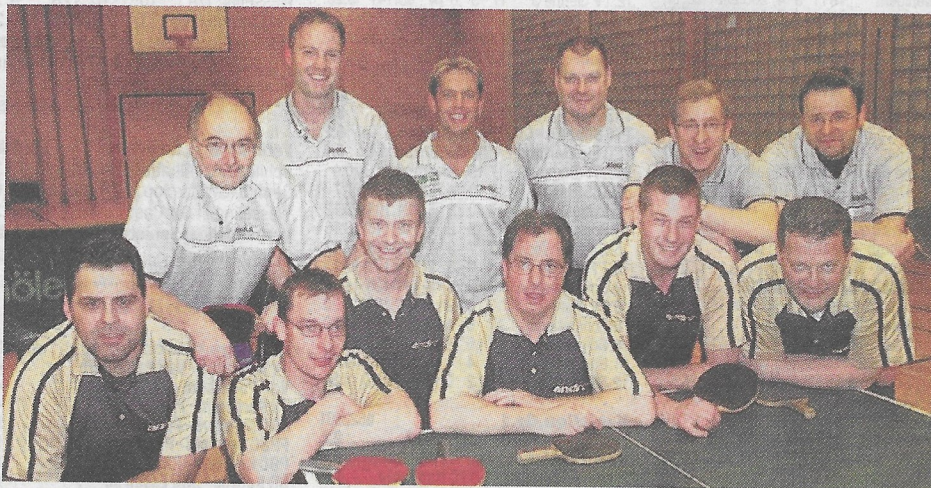
Ein teilweise hochklassiges Derby lieferten sich in der Tischtennis-Kreisliga der Gastgeber Roland Rauxel 4 (vorne) und der Post SV Castrop 2.

Postler siegen im Kreisliga-Derby bei Roland Rauxel mit 9:7