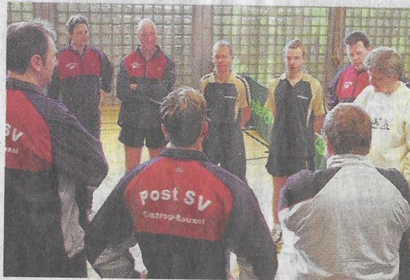
Nachbarn: Die TT-Cracks von Roland Rauxel 2 und Post SV Castrop I bei der Begrüßung.

Das Pleckenschwingen der Ortsnachbarn war gut besucht, ließ aber kaum Knis-