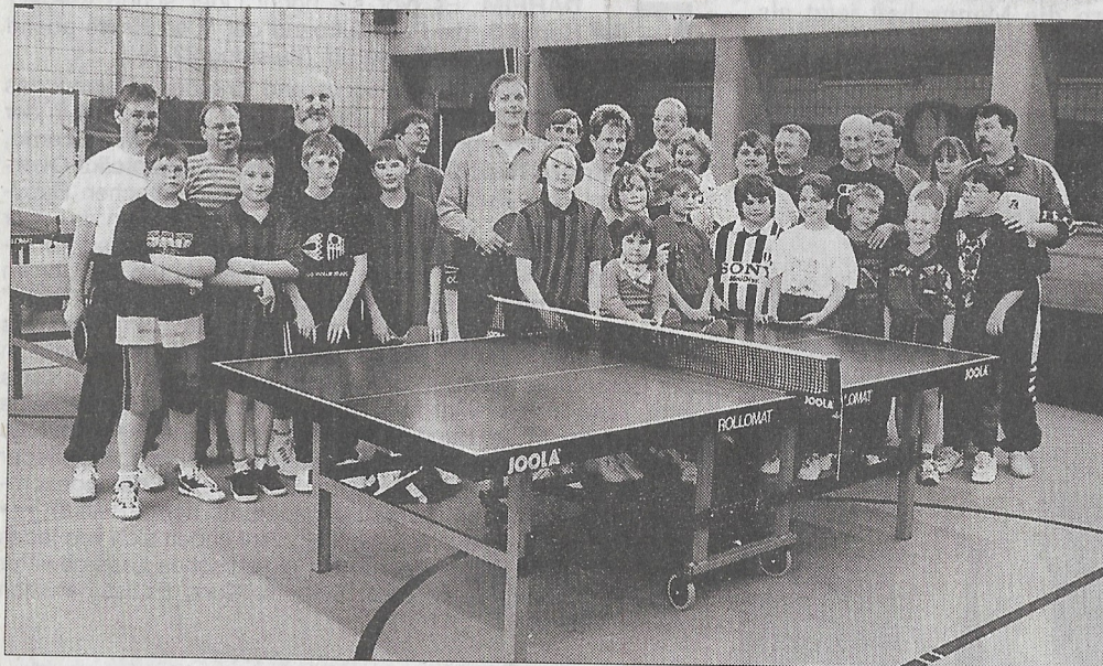
Kinder und Eltern standen beim PSV gemeinsam an der Tischtennisplatte.

Familie Pogorzelski beim PSV erfolgreich