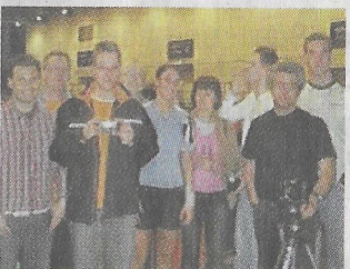
Die Schlachtenbummler des Post SV Castrop machten bei der WM in Bremen mächtig Stimmung.