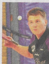
Fällt aus: Robin Gude.

Die letzten Duelle sahen dabei aber immer leichte Vorteile für die Mannen von der Bahnhofstraße. Ro-