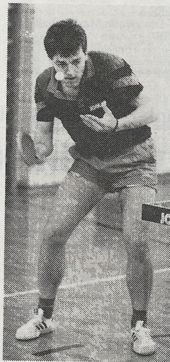
Jörg Wagner: Die PSV-Herren beginnen daheim gegen Bergkamen.