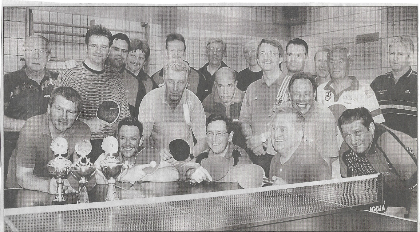
Stolz präsentieren Sieger und Besiegte bei den Senioren-Tischtennis-Stadtmeisterschaften die Pokale. Insgesamt hatte Veranstalter Post SV Castrop mit 20 Startern einen neuen Teilnehmerrekord zu vermelden.