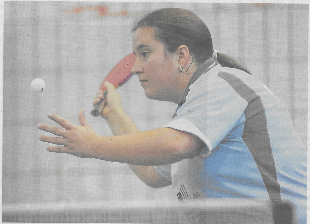
Die Damen des Post SV kassierten gegen Annen die erste Niederlage der Saison.