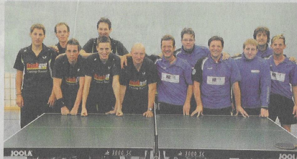
Nicht nur im Fußball, auch im Tischtennis gab's ein Landesliga-Derby. Das gewann der Gastgeber Post SV Castrop (rechts vom Netz) recht klar mit 9:4 gegen Roland Rauxel (links).

Nach so einer relativ klaren Sache hatte es nach dem ersten Spieltag nicht ausgesehen. Die Roländer, zwar auch mit einer Niederlage gestartet, hatten aber immerhin gegen den Titelfavoriten TTC Gahmen gut gespielt. Die Postler hatten dagegen in Eving-Lindenhorst, einem Aufsteiger, schlecht ausgesehen.